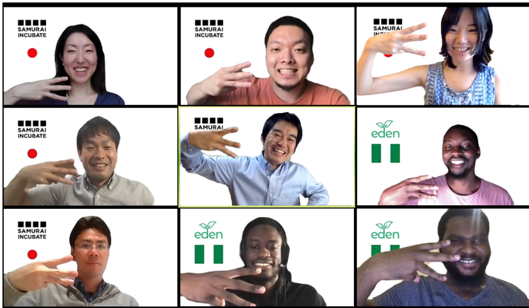
Eden の「E」のポーズをするサムラインキューベート及びサムライアフリカの投資メンバーと Eden メンバー

Eden は、多忙なビジネスマン向けに、安心・安全に家事代行サービスを提供するナイジェリアのスタートアップです。公共交通機関が未発達かつ渋滞がひどいナイジェリア・ラゴス在住者は、通勤に片道2~3.5